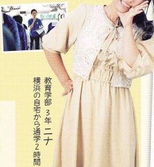
教育学部 3年 二ナ 授業の目的が「通学」時間

ドラマや映画の大学ロケ地ランキング全国6位。自然も設備もまずは見に来て! 約20分でキャンパスをめぐるパスツアーがオススメ!