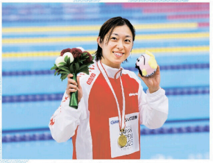
昨年のジャパンオープンで優勝(2025年11月、東京)

【記事】横田幸奈 【レイアウト】宮本晴美