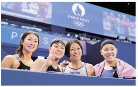
感想はこちらから

座右の銘は「騎士道精神」。一度戦いに負けた者が、勢いを盛り返して、再び攻めてくること、の意。「中学から高校の国語の授業で習った時に、『これかっこいい！ いいじゃん』って思ってから、ずっと掲げてます。2016年のリオ五輪では準決勝で敗退し、その後5年間、日本代表から遠ざかった。それでも過去の自分を超えたいと、過酷な練習を地道に積み重ね、完全復活を遂げた。座右の銘のままに、今、さらなる進化を続けている。